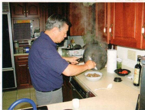
李博士也會親自下廚烹煮拿手好菜

趕緊將這些禮物送到老師的房間，竟發現老師的房間跟我們的完全不一樣，十分簡陋，此時才恍然大悟，原來老師將他的豪華套房讓給我們，自己屈身在小房間，他沒多做解釋，只是淡淡的說，那是雙人的房間比較大，較適合給你們住。其實老師當天已經講了整天的課，一般人應該很累才是，但他卻仍然精神奕奕，且毫不吝嗇，打開那瓶名貴的紅酒和我們一同分享，也趁機分享他的經驗，幫我們指點迷津；這次閒聊、品酒的過程，配酒的『小菜』是比紅酒更香醇的寶貴人生經驗分享。當時我們才剛到美國，內心真是充滿著溫馨與感動。他常以過來人的身份，對我們的未來規劃給予適當的評估及建議，交談、請益的內容，包羅萬象，而老師的解惑也總充滿著無窮的睿智。其實當初我決定出國前，剛好警察局有個難得的升職的機會（鑑識組長出缺），無論年資、經歷、積分都是我排第一，當時的鑑識組長薪資還比刑警隊長高，甚至不輸警察局長，是警界公認的好缺，若放棄此次升官機會，縱使我出國拿博士學位回來，再等十年也不一定有機會。因此所有警界的長官、朋友都勸我不要出國了，要掌握這個難得的晉升機會。老師知道此事後，只是淡淡的說「我一輩子最