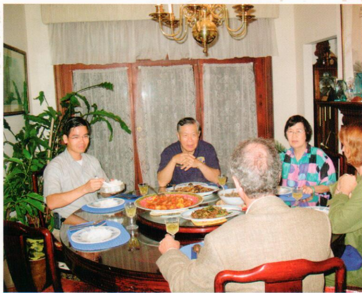
李博士與夫人平時在家宴客

除了早期的學生有接送、留宿的『福利』外；近期的學生，只要事先聯絡好要拜訪的，老師都一定會特地撥出時間，設宴款待。若在美國停留時間較久的，更有機會品嚐到師母的好手藝，不管是感恩節、聖誕節、農曆過年等重要節日，師母都會撥冗親展手藝，讓在異鄉的遊子，能品嚐些家鄉味。無論是親自掌廚做些家常菜，或在院子裡烤肉，邀請大家同聚暢談，都是學生們公認留美期間最溫馨的記憶。這份歡樂的氣氛是難以想像的情境，因為大家每次看老師