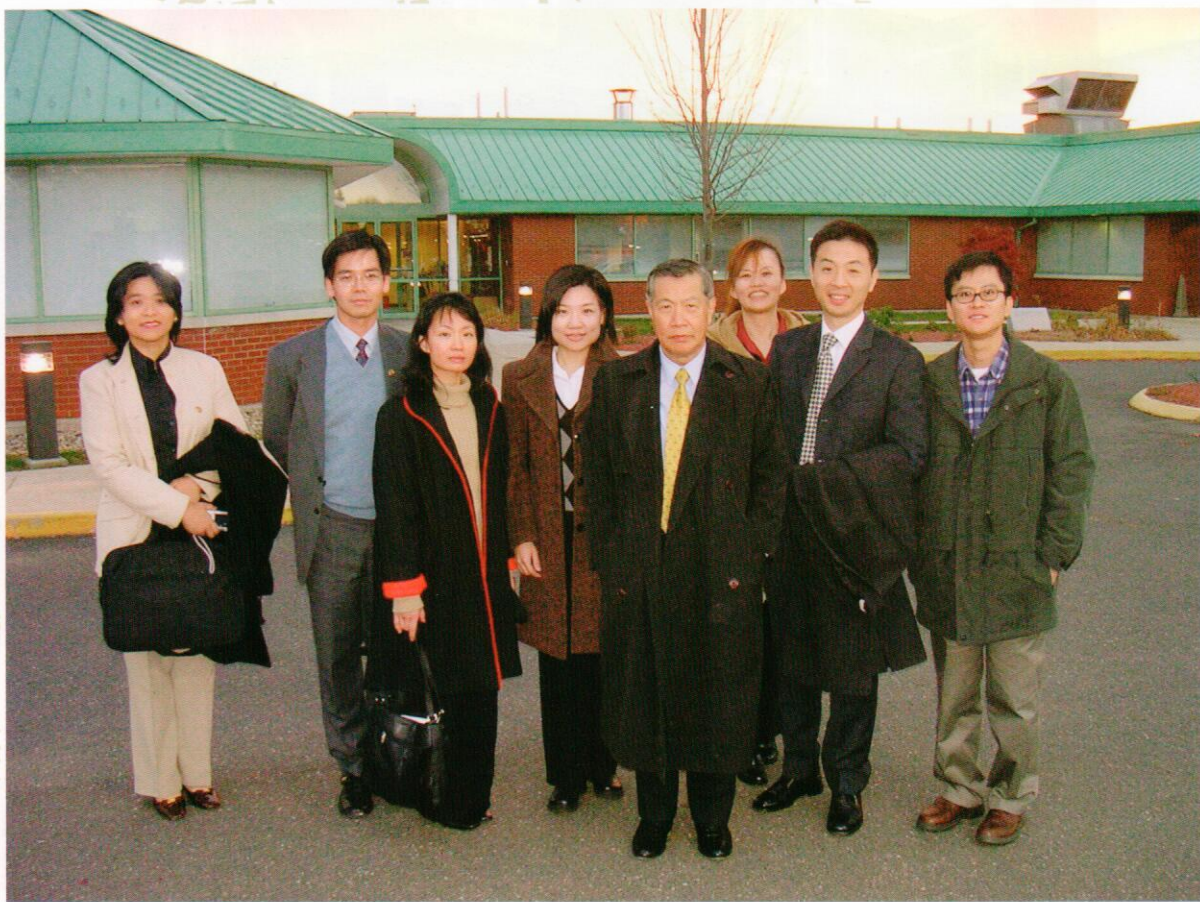
李博士帶領台灣來訪的檢察官、法官及學者參訪刑事實驗室

研究院及博物館，有些捐贈給刑事實驗室，當為研究鑑識科技獎學金，用來資助後期晚輩到美國學習新型鑑識科技的費用。籌建紐海芬大學的鑑識科學研究院及最新型的鑑識博物館，以提升鑑識科學教育，一直是老師努力的目標，這個目標一步一腳印的實現。2007年3月，康州紐海芬大學刑事司法和鑑識科學學院（College of Criminal Justice and Forensic Sciences）就以老師的名字（Henry C Lee）命名，康州州長瑞爾女士同時宣佈將2007年3月1日定為「李昌鈺博士刑事司法和鑑識科學學院日」；同年的11月，遠在數